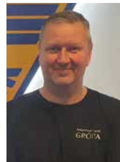
Hlynur Morthens Vallarstjóri Vivaldivallar