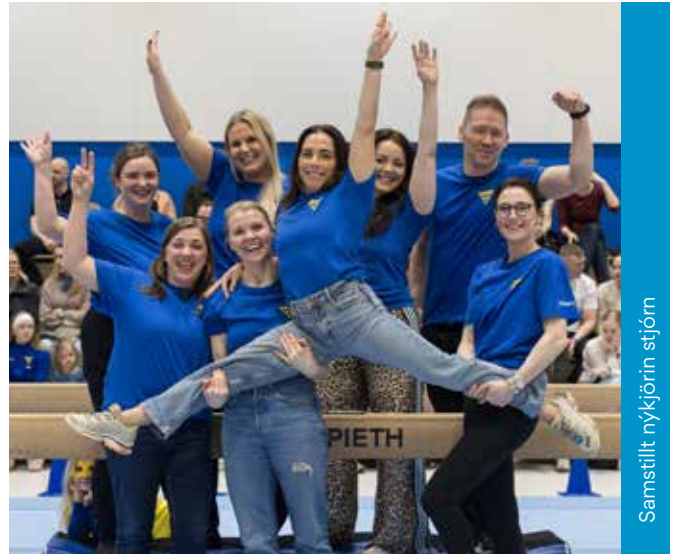
Samstílt mykjin stjórn

Þetta var líka ár mikilla umbreytinga hjá deildinni og sú vinna hefur gengið afskaplega vel og mun halda áfram næstu ár. Eins og þeir sem hafa æft fimleikar vita, að þá er mikil vinna sem liggur að baki litlu sigrunum eins og fyrsta handahlaupinu, kippinum, flikkinu eða heljarstökkinu. En þegar grunnurinn er orðinn góður, er auðveldara að taka stærri stökk og bæta við alls konar skrúfum og pinnlenda. Það er takmarkið og ég er sannfærð um að framtíðin sé björt fyrir fimleikadeildina okkar.