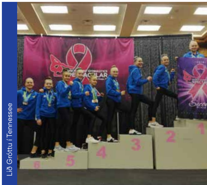
Lið Gróttu í Tennessee