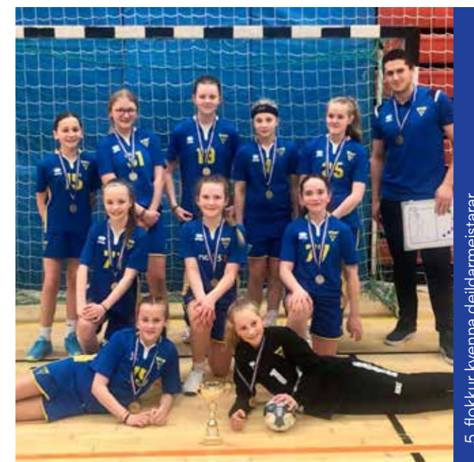
5. flokkur kvenna deildarmeistarar

deildir geri að sínum og vinni markvisst að því að innleiða þau með virkum hætti í störf sín. Yngri iðkendur æfa oft tvær og jafnvel allar þrjár íþróttagreinarnar sem félagið býður upp á og því skiptir máli að deildirnar hafi sameiginleg gildi.