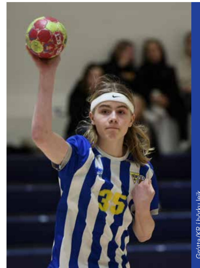
Gróttu/KR í hörku leik

Eins og áður sagði er hins vegar mikilvægt að Íþróttafélagið Gróttu skilgreini gildi sín sem allar