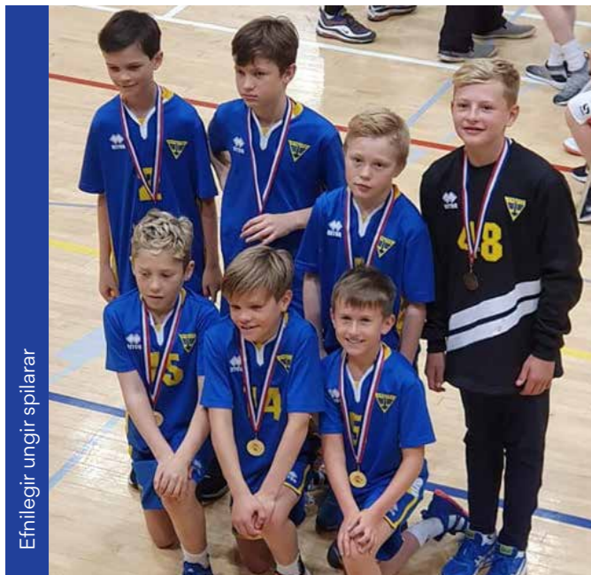
Efnilegir ungir spilarar